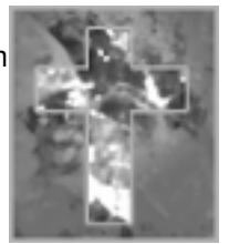
Bild der Vereinten Herzen: 2. Juni 2007, Ich sehe das Herz des Vaters als eine riesige Flamme. Er sagt: „Ich bin das Ewige Jetzt. Ich bin gekommen, um das Herz der Welt zu erleuchten, damit es die Bedeutung des neuen Bildes der Vereinten Herzen der Heiligsten Dreifaltigkeit und des Unbefleckten Herzens Mariens erkenne . In der Welt steht noch ein marianisches Dogma zur Verkündigung an, jenes von

Jesus, 2. April 1999: „Ich bin gekommen, damit du besser verstehst, dass die Kreuzigung, bei der Ich vor 2000 Jahren gelitten habe und gestorben bin, in der Welt von heute weitergeht . Zunächst geschieht dies im Opfer der Heiligen Messe. Diese ist kein Mahl, sondern ein Opfer. Bei den Modernisten wird dies nicht betont, da sie es vorziehen, Mein Göttliches und liebevolles Opfer als Grundlage der Heiligen Messe zu negieren.“ „So wie Mein Opfer vor 2000 Jahren Göttlich war, so ist Mein Kommen heute in der Heiligen Eucharistie Göttliche Liebe.“ „ Meine Kreuzigung geht weiter in jedem Verbrechen, das in der Welt an Unschuldigen verübt wird – bei jeder Gewalt gegen menschliche Rechte – in der Tat bei jeder Gewalt gegen die Heilige Liebe selbst. “ „Die erste Kreuzigung richtet sich gegen die Göttliche Liebe. Heute wird die Göttliche Liebe auch durch jede Verletzung der Heiligen Liebe verwundet und getötet. “ „Sähe Liebe in deiner Umgebung. Ich werde dir helfen.“